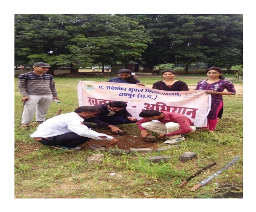
Plantation On 02 October 2017