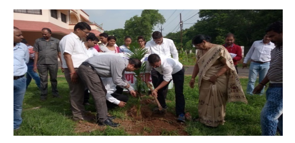
Plantation by the Registrar of the university Shri Dharmesh Sahu (IAS)