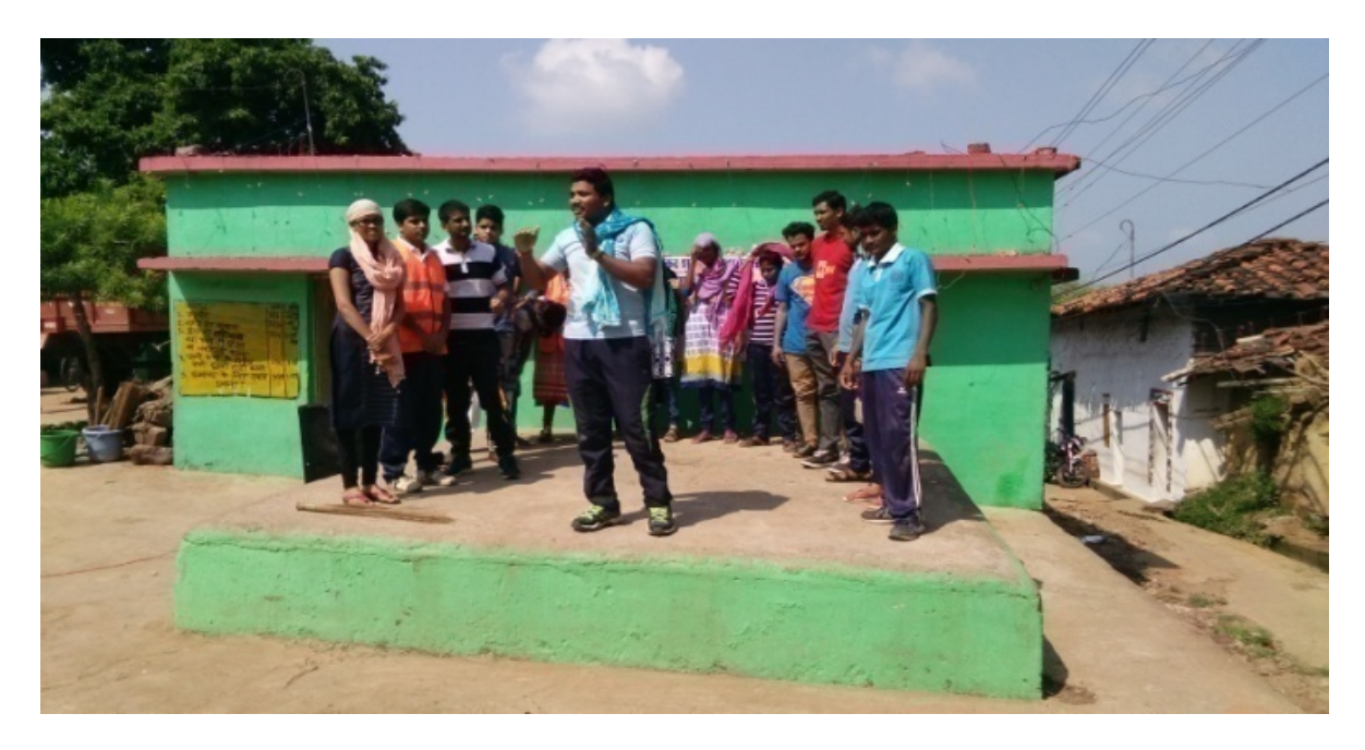
Nukkad based on swakchhata