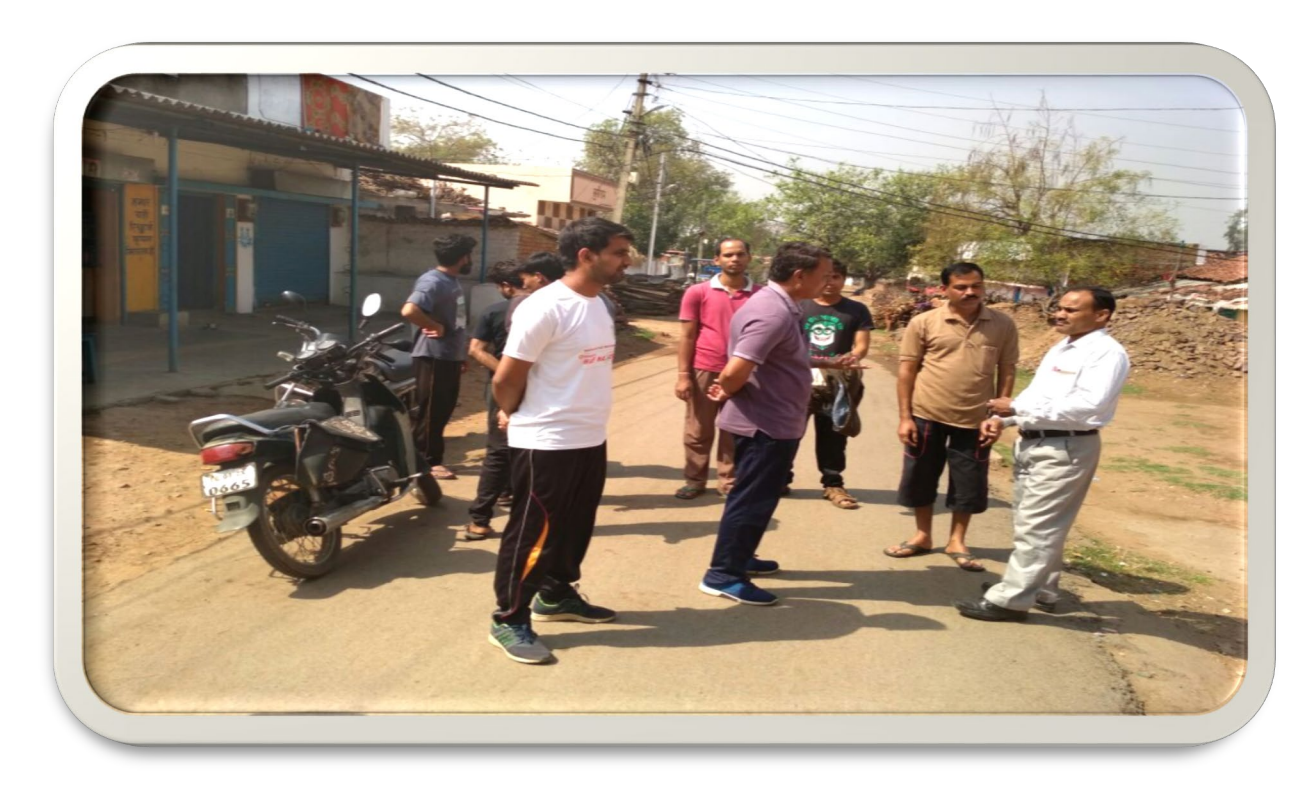
Discussion with the Principal of High school of the Atari village on dropout issue