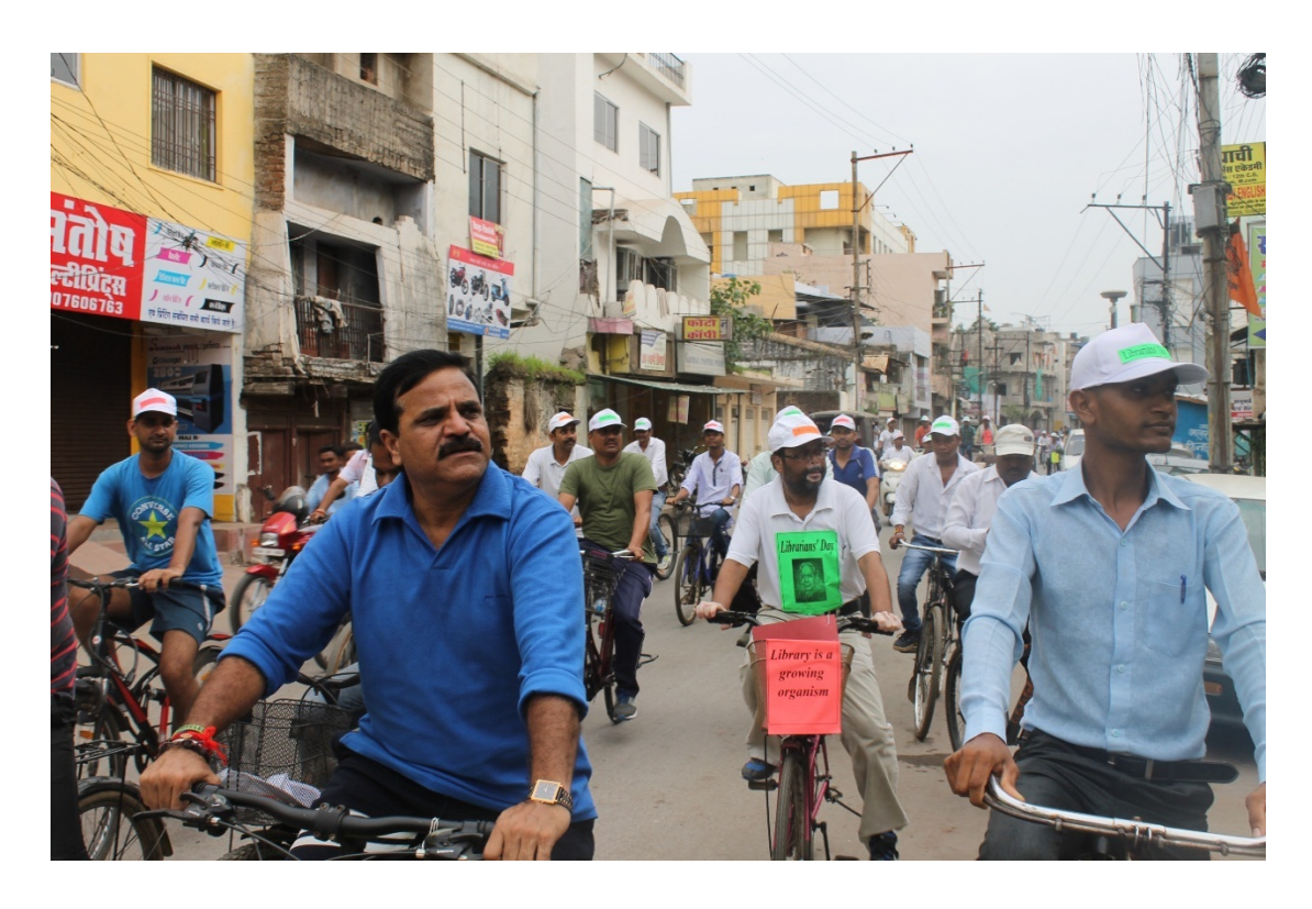
On this Occasion mayor of the Raipur city has Lead the Rally