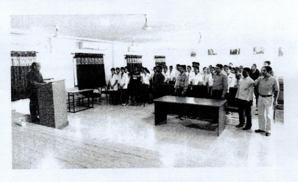
Fig.1 Oath for "Swatchata Hi Sewa"

"Swatchata Hi Sewa" the oath was taken on September 15, 2017, at 3.35 PM by the whole department, under the leadership of HoD-Biotechnology to achieve the national goal of Swachh Bharat Abhiyan . All the faculty members, supporting staff, research scholars, and the students of M.Sc. I and III semesters actively participated. Head of the Department inclined all the participants to follow the oath and also inculcate it in others too. Further, cleanliness drive was successfully organized in the premises of the school on Sept 16, 2017, at 3:30 pm onwards. Unwanted weeds were rooted, other garbage also disposed-off by all the stakeholders of the department during the activity. Here some of the related photographs are attached for reference.