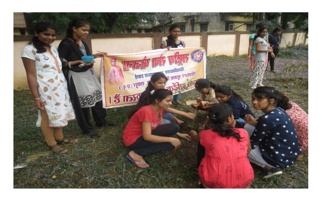
Plantation on 2 Aug.2017