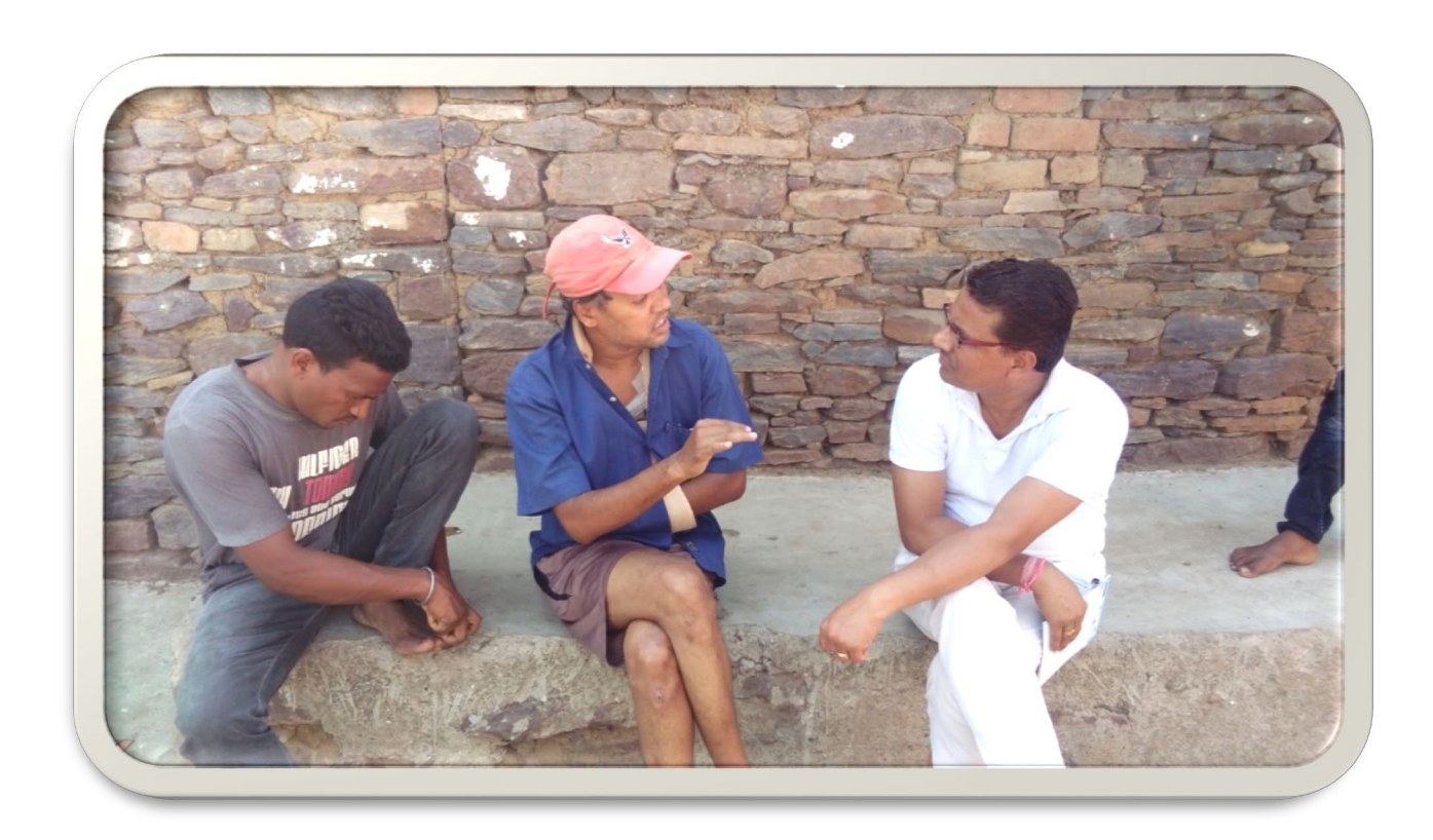
Discussion with youth of the Atari village on dropout issue