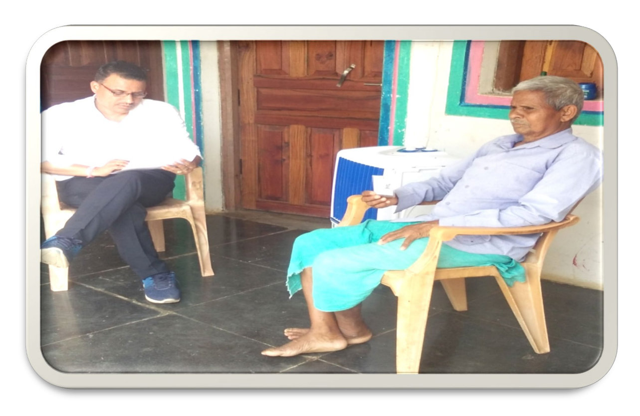
Discussion with older Parents & women on dropout issue