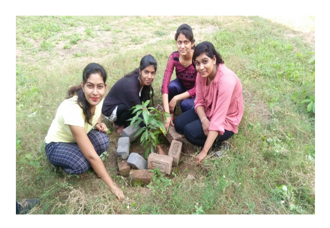
Plantation On 07 october 2017