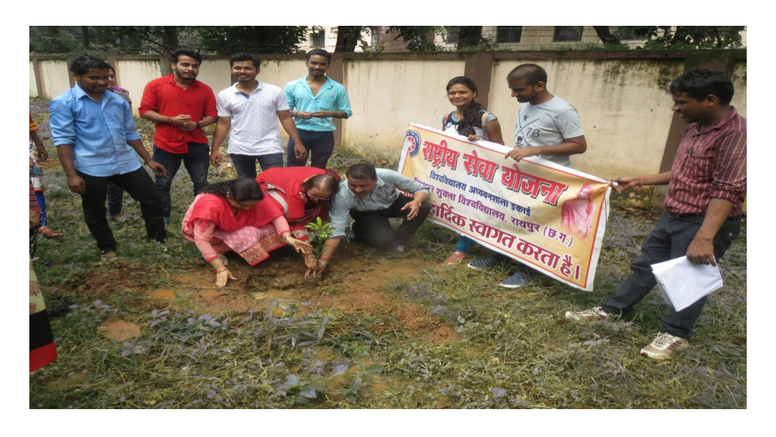
Plantation by the students of Girls hostel