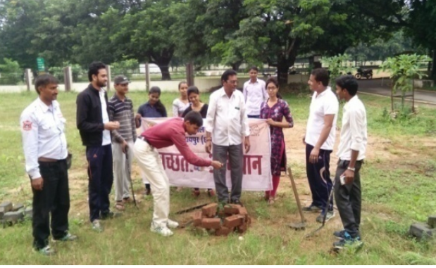
On this occasion Registrar of the university is sharing the experience with the volunteers of the UTD NSS