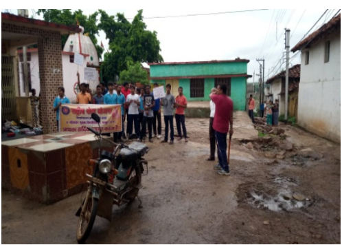
Swakchhta rally with school children 20 Jan 2018