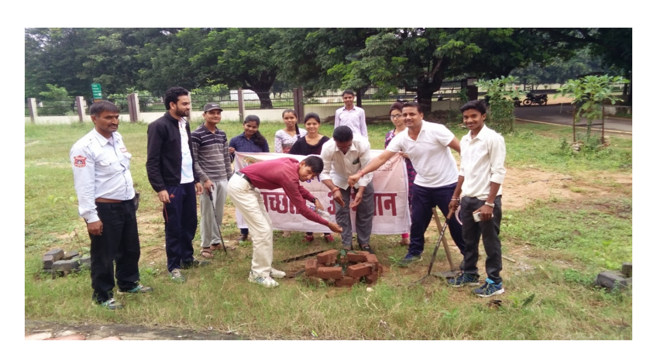
Plantation On 02 october 2017