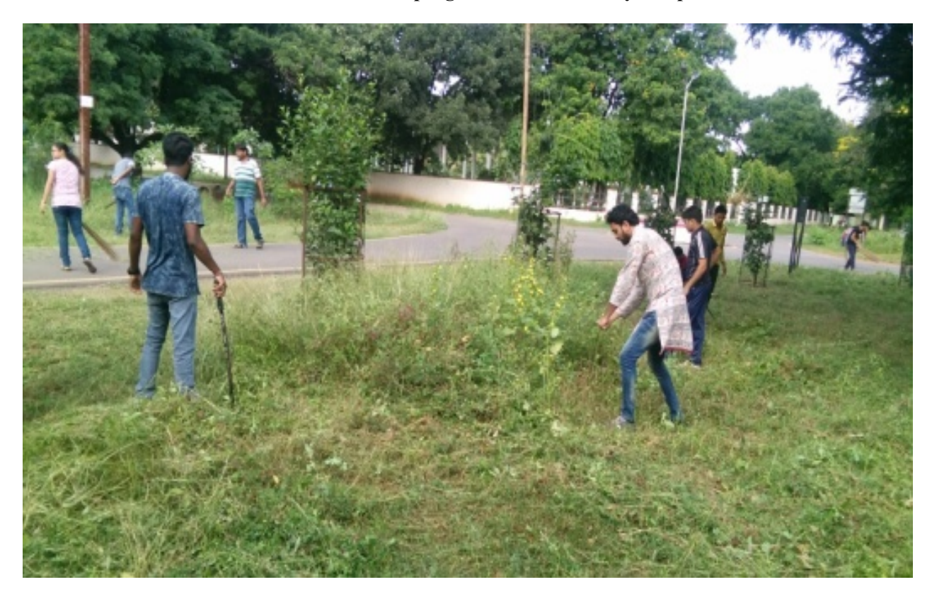
Swachhata Abhiyan in University Campus