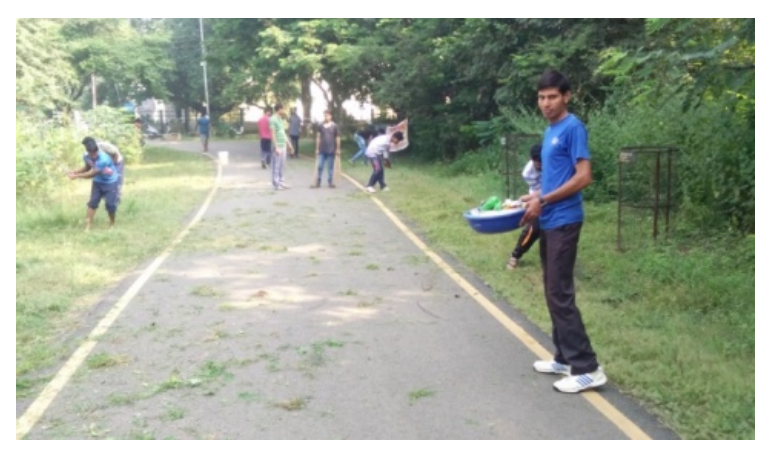
15 Oct 17 swakchhata programme in university campus