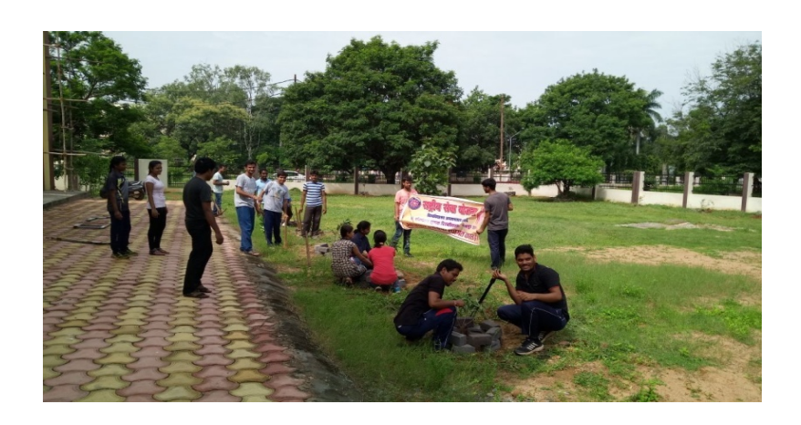
13 August 2017 Plantation by security guard & p.o.in campus