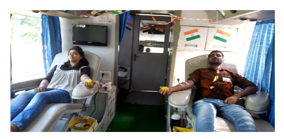
Blood donation camp on 22 Aug.2017