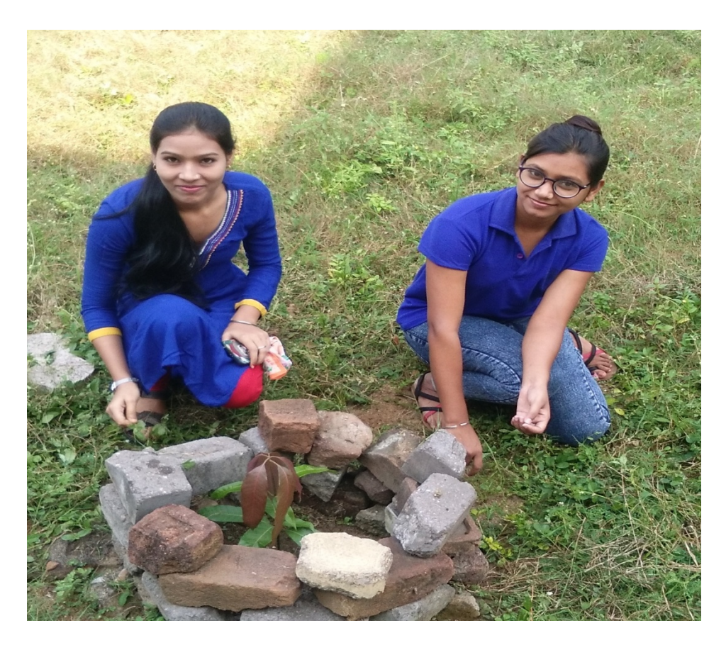
07 October 2017