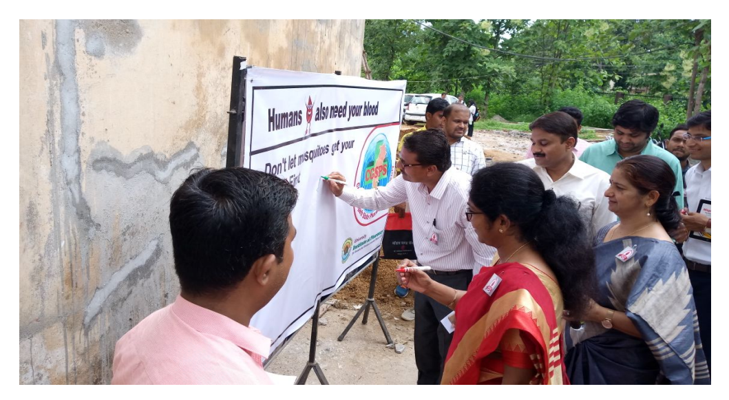
donation camp on 22 Aug.2017