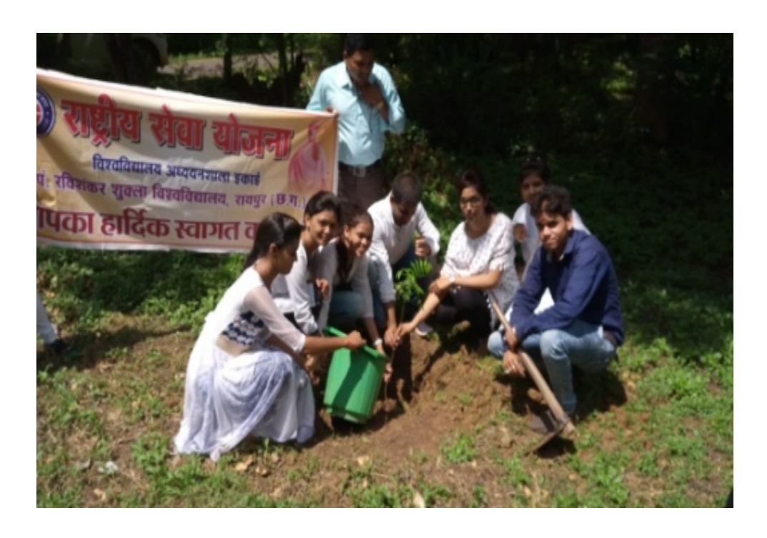
Plantation By the NSS volunteers