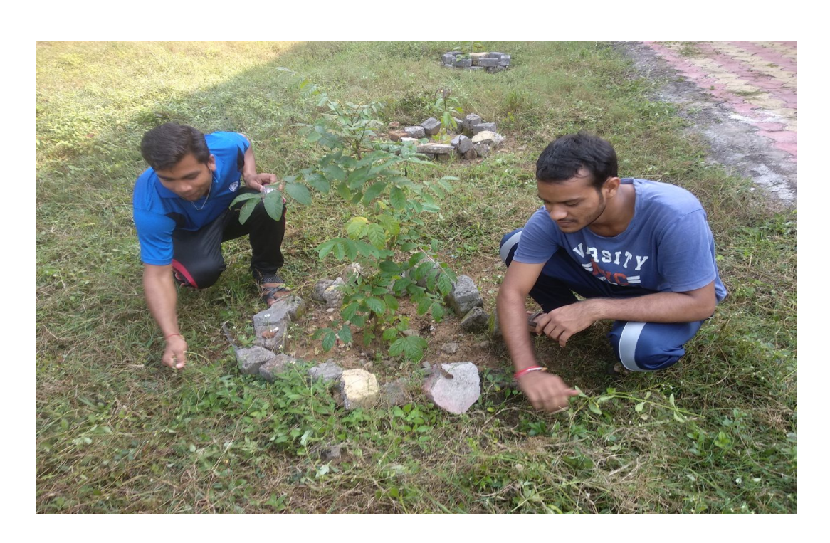
Plantation On 07 october 2017