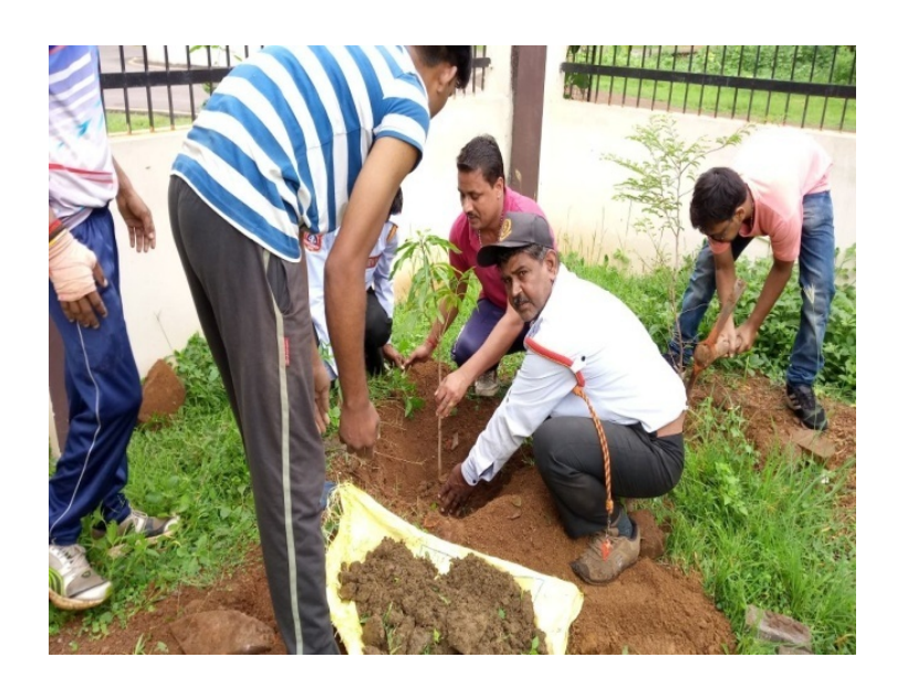
Plantation on 13 Aug.2017