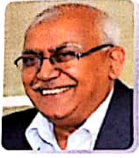
डॉ. एस.के. पाण्डेय कुलपति