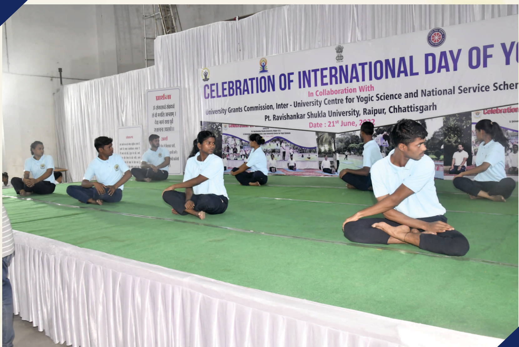
Yoga Expert demonstrating on Stage