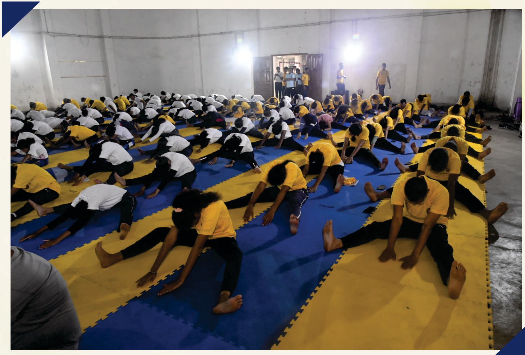
Participants performing during celebrating