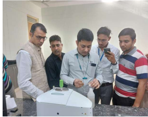
Day 3 - 26 नवंबर 2022