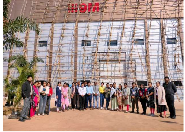
Day 4 - 27 नवंबर 2022